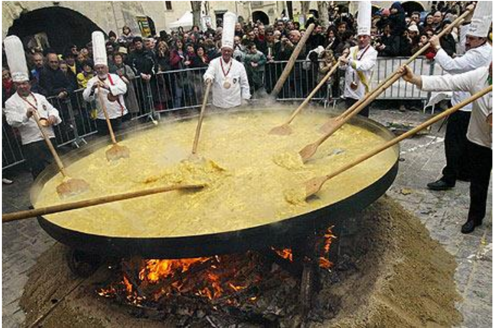
Tradicionālā Lieldienu kulteņa gatavošana Anglijā