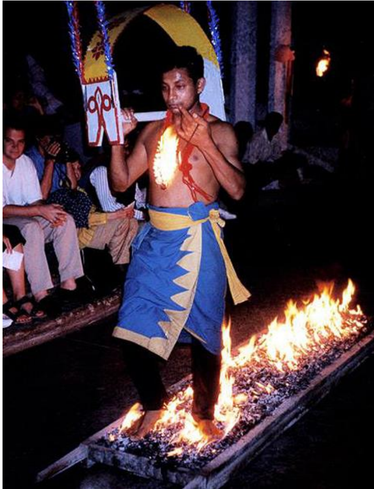
Štaigāšanas pa uguni rituāls Šrilankas salā Āzijā