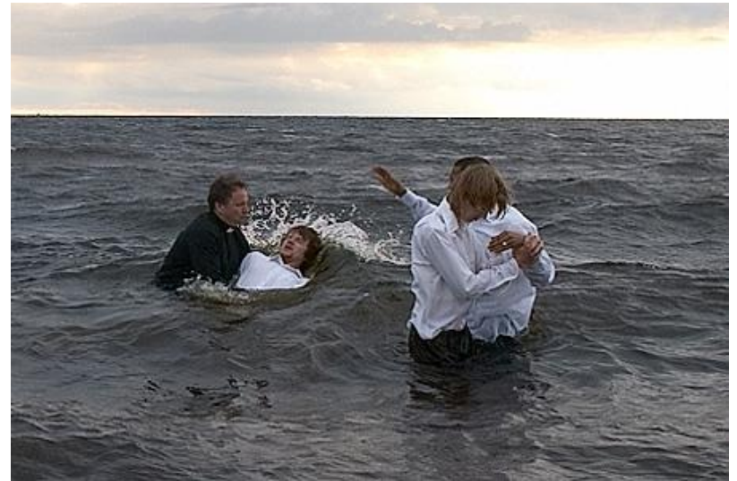
Kristīšanas rituāls jūrā