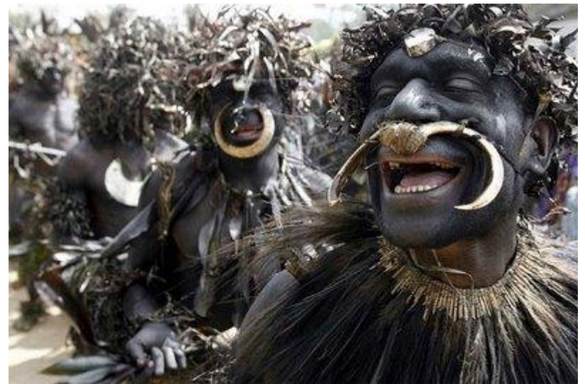
Sambia cilts iniciācijas rituālā dejas Papua Jaungvinejā